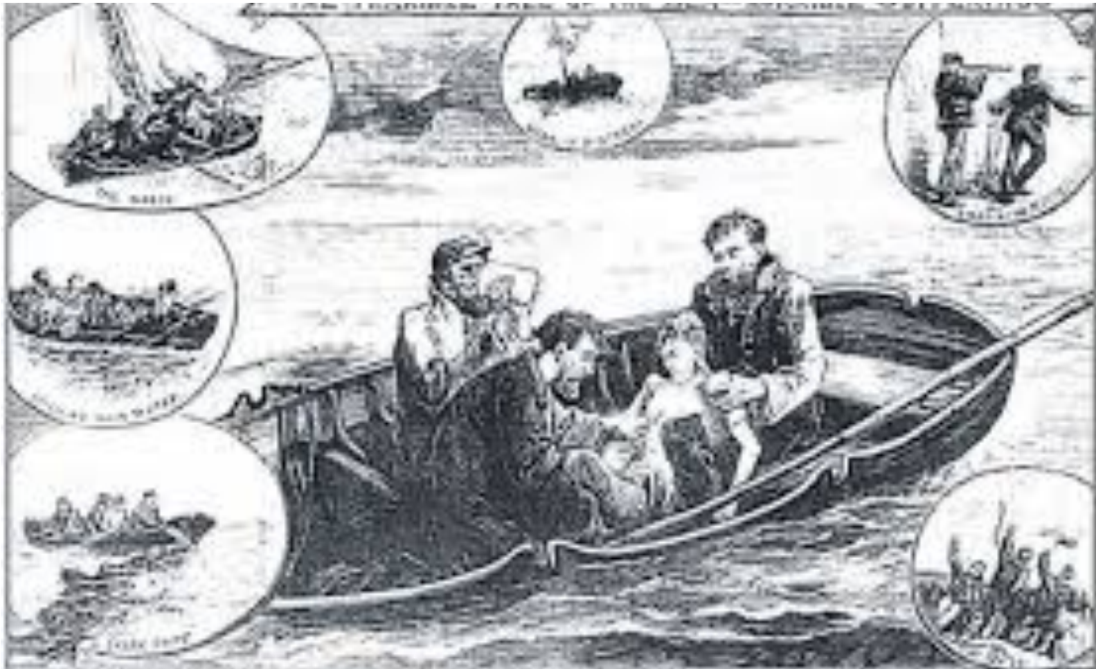
The Queen vs Dudley and Stephens 1884