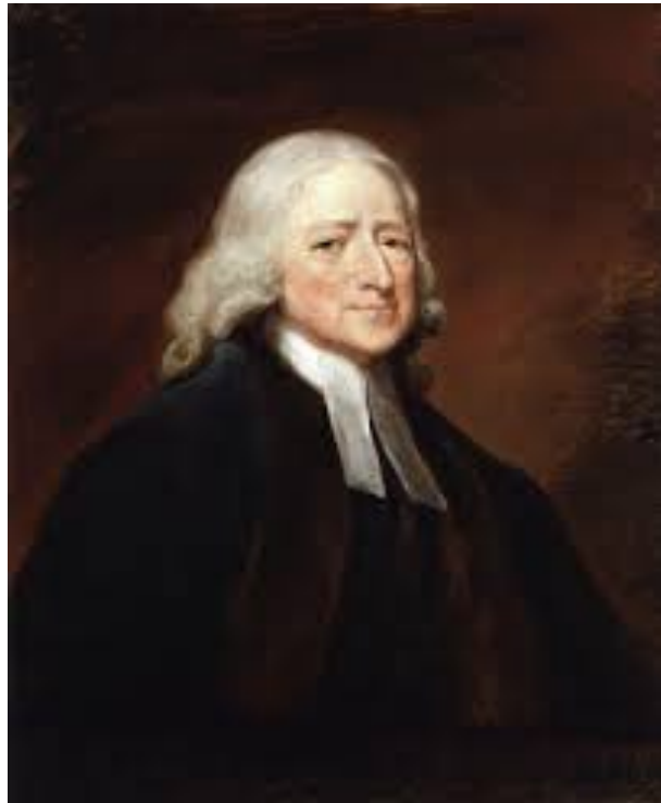
John Wesley 1703-1791