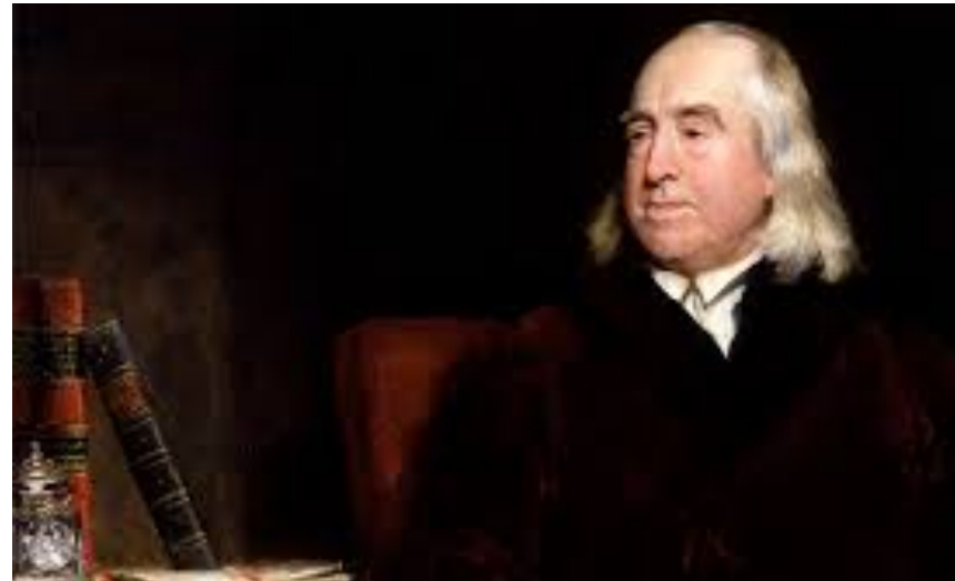
Jeremy Bentham 1748-1832